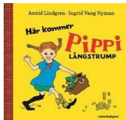
▲ Pipi dlouhá punčocha (1945) Astrid Lindgren

Boj proti mocným, složitý život chudých, lidská důstojnost, jsou univerzální témata, která se v umění opakují. Kniha vypráví příběh jedné rodiny, která musela opustit svůj domov během Velké hospodářské krize ve Spojených státech. Jejich život není snadný, někdy bez špetky naděje. Kniha popisuje boj malé rodiny ve světě v nesmírně složitých časech.