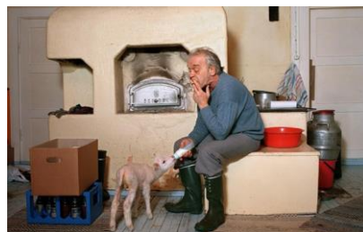
▲ Esko Männikkö, finský fotograf