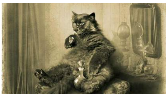
◀ Mistr a Markétka (1967/1973) Mikhail Bulgakov

Pippi je malá holka, která přijíždí sama do malého švédského městečka na venkově. Vypadá, že nemá minulost a ani žádné velké plány do budoucna. Její dětský způsob zabydlení se a startu nového života s vlastními pravidly je nádherný.