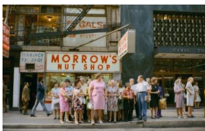
▲ Stephen shore, americký fotograf