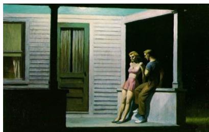
▲ Edward Hopper ( Summer evening , 1947)